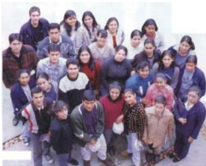
Yo no soy el Cristo, sino que he sido enviado delante de él...